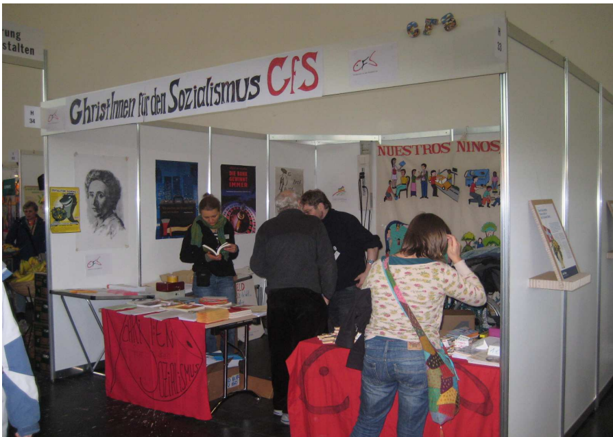
Unser Stand auf dem Ökumenischen Kirchentag in München 2010

Ingrid Schellhammer, Mannheim, September 2010